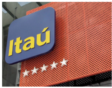
Alteração no Plano Médico 2

A Justiça do Trabalho condenou o Itaú Unibanco a pagar R$ 1 milhão de indenização por dano moral coletivo aos trabalhadores, em Campinas.