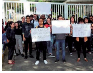
Protestos na Metodista