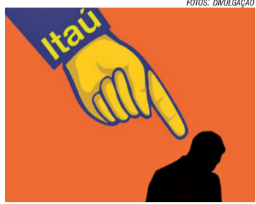
Alteração no Plano Médico 1

A Justiça do Trabalho condenou o Itaú Unibanco a pagar R$ 1 milhão de indenização por dano moral coletivo aos trabalhadores, em Campinas.